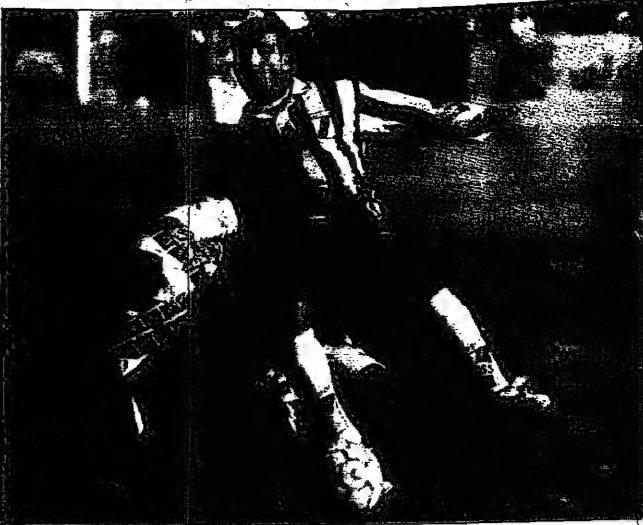
لجنة من المراكز العالمية في كأس الاتحاد الإفريقي التي فاز بها فريق الصناديق التونسي من بطولة إفريقيا